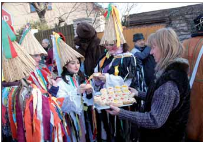
Vítaným zpestřením byly zastávky u hospodářů, kteří průvod vždy štědře pohostili.