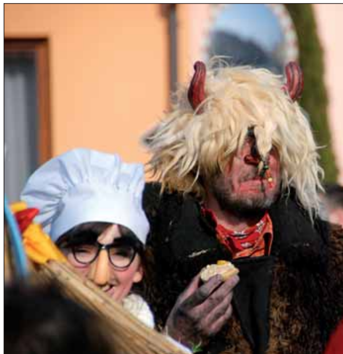
Dvoumetrový čert budil respekt.