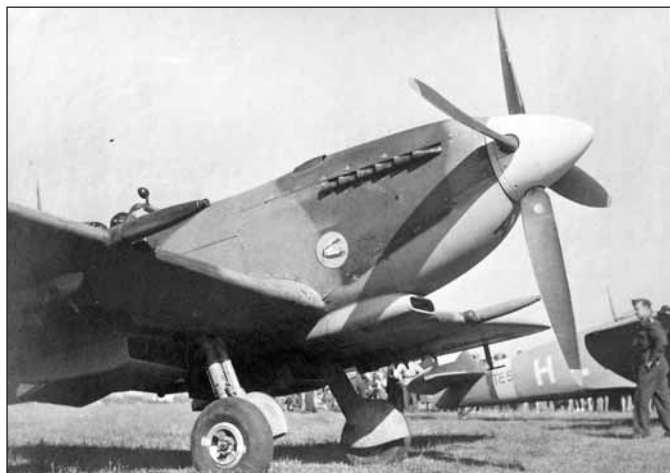
Kovač stíhal Němce v moderních letounech Spitfire.