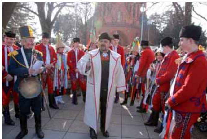
Fašank zahájili Poštorani tradičně před kostelem.

slední příležitost před dlouhým obdobím masopustu. Nemohly chybět tradiční masky jako medvěd, žid nebo policajt, úsměv na tvářích dětí i dospělých však vykouzlila třeba přerostlá skupina batolat, respekt vzbuzoval dvoumetrový čert. (dav)