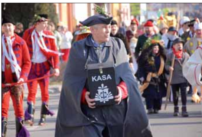
Výběřcímu daroval nějaký ten peníz většinou každý rád.