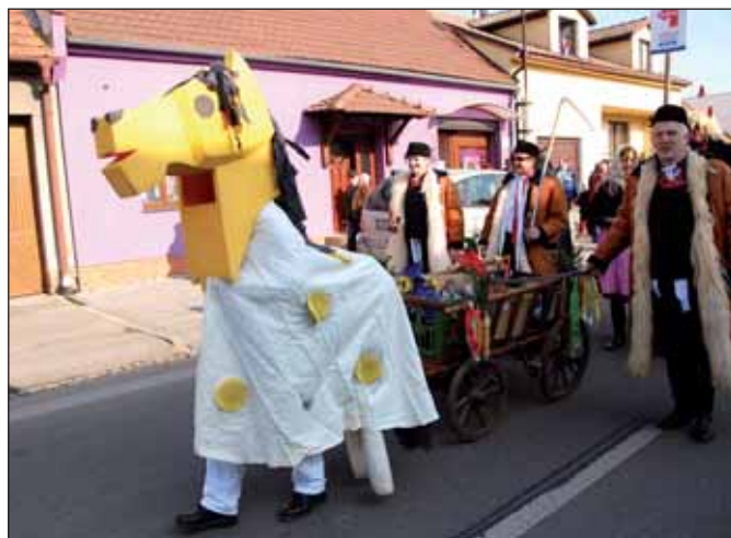
Koně v průvodu nemohl přehlédnout nikdo.