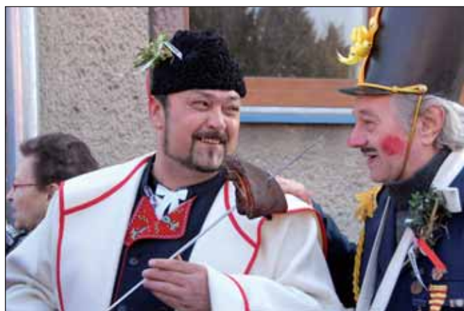
Prouzený špek voněl na desítky metrů.